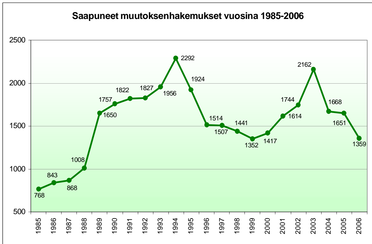
Kuva 1. Kuntien eläkelautakuntaan saapuneet hakemukset vuosina 1985 -2006

Vuonna 2006 kuntien eläkelautakunta ratkaisi 1 776 muutoksenhakemusta ja vuonna 2005 1 408 muutoksenhakemusta, joten muutoksenhakemuksia on ratkaistu kertomusvuonna 368 tapausta enemmän kuin vuonna 2005. Vuonna 2006 päätös on muuttunut kuntien eläkelautakunnassa kaikkien ratkaistujen asioiden osalta muutoksenhakemuksen johdosta 316 kertaa (18 %) ja vuonna 2005 265 kertaa (19 %).